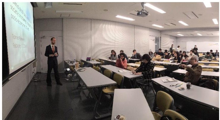
博士論文公聴会の様子